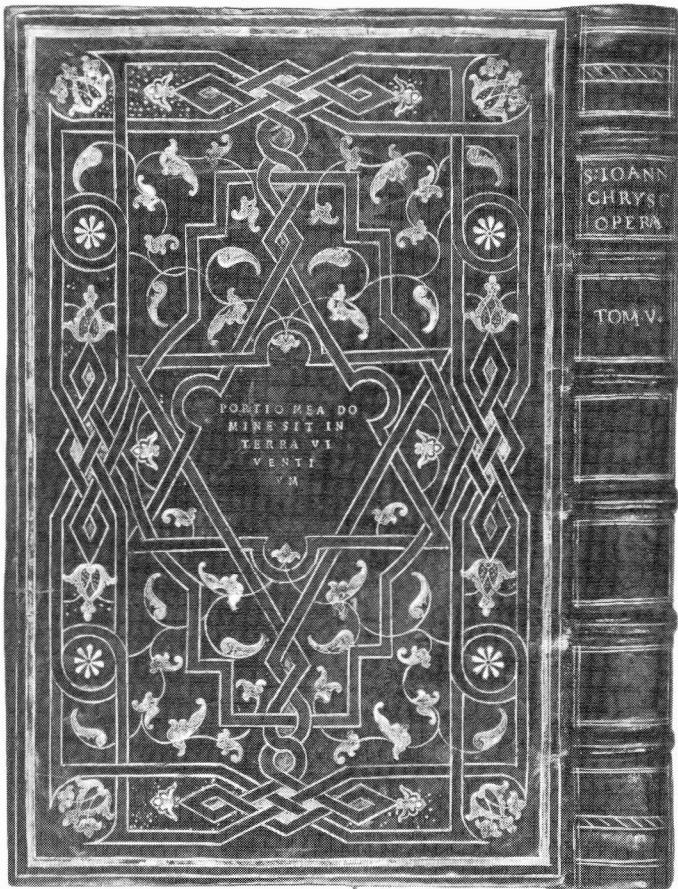
'Grolier-band', gebonden te Parijs, ca. 1550. KB Den Haag, 225 E 5. Te zien in Den Haag, Reedijk-tentoonstelling.

MIDDELEEUWSE manuscripten. Nederlands Kunsthistorisch Jaarboek 36 (1985). Stichting Nederlandse Kunst- historische Publicaties, 1985. 197 p. ill. Fl 145. ISBN 90 228 4440 4. Themanummer over handschriften- verluchting met onder meer een catalogus van Italiaanse handschriften in Nederlands bezit en enkele, deels methodologisch opgezette, studies.