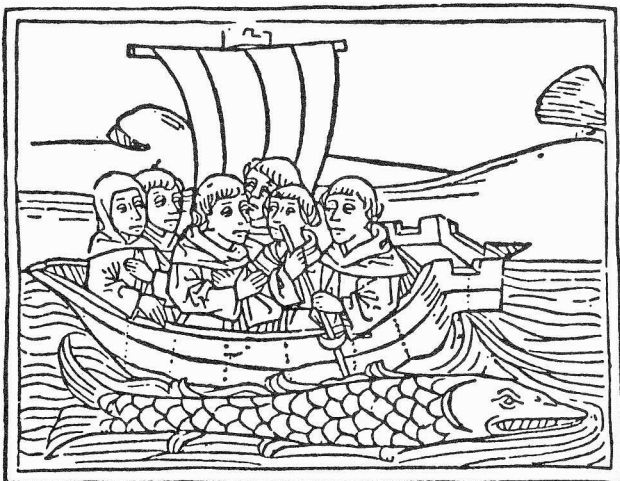
St Brandaan en walvis. Te zien in Utrecht en 's-Gravenhage.

Seminar in the History of the Book before 1500, 3-5 juli 1986. Veel aandacht zal worden geschonken aan terminologie, o.a. aan de hand van het recente 'Vocabulaire codicologique' van Denis Muzerelle. Inlichtingen: mrs Linda Brownrigg, 56 Staunton Road, Oxford OX3 7TP.